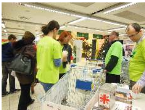
Jeden zo zachytených momentov zbierky

Vlani v takejto dobročinnnej zbierke získali pre Domov sv. Jána z Boha tonu potravín, s ktorou dokázali pomáhať ľuďom v núdzi a bez domova teplým jedlom až tri mesiace v roku. Aj tentoraz boli dobrodinci štedrí. V jeden deň zbierky venovali pre spomínané zariadenie milosrdných bratov na Hattalovej ulici v Bratislave 1034,8 kíl trvanlivých potravín a drogériu v hodnote 1609,40 eur, pričom ešte do pokladničky vložili okrem toho