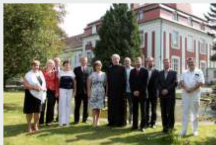
společná fotka v zahradě NMB Vizovice