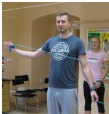
účastníci kurzu při cvičení SM-systémem