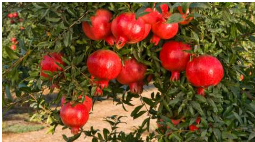
strom s granátovými jablky, která se stala symbolem milosrdných bratří