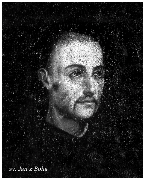
sv. Jan z Boha

„Přál bych si, aby všichni nemocní věděli, že je mám v srdci, ať už jsou v nemocnici, doma, anebo bez povšimnutí kolemjdoucích někde na ulici... Jsou jedině mé dědictví, které vám zanechávám, protože kromě nich nemám nic. Uctívejte moji památku tak, že se o ně budete starat s ještě větší láskou, než jsem dokázal já... Mějte otevřené oči a uši pro bližní, kteří jsou zbaveni rozumu... pro staré, pro odkázané na pomoc druhých, pro osamocené tam, kde se nedostává lásky a péče, kterou si zaslouží... pro lidi, kteří jsou pro nemoc připoutaní na lůžko nebo invalidní vozík... pro prostitutky, drogově závislé, na které se často shlíží s odporem a lhostejností. Právě oni, sužovaní pocitem viny a bezvýchodnosti, potřebují více jak kdokoli jiný porozumění a lidské teplo.“