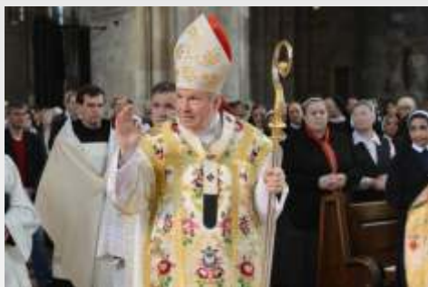
hlavní celebrant kardinál Christoph Schönborn

Na začátku září pak milosrdní bratři uspořádali den otevřených dveří v nemocnici a pouliční slavnost pro veřejnost. Oslavy však pokračují i děkováním Pánu a Panně Marii za ochranu vídeňské nemocnice.