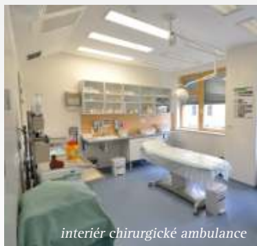
interiér chirurgické ambulance